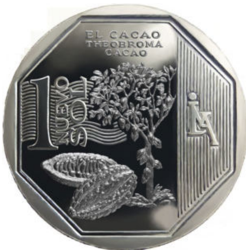
Anverso de la moneda de Un Nuevo Sol con la planta de cacao. Museo Central del Banco Central de Reserva del Perú - MUCEN (2013). Serie numismática Recursos Naturales del Perú - El Cacao (Numismática). Remitido por la institución.

En los últimos años, el Banco Central de Reserva del Perú decidió destacar y dar reconocimiento en la moneda de Un Nuevo Sol a algunos productos naturales significativos en el país como la quinua, la anchoveta y, por supuesto, el cacao. En esta moneda, aparece, en el centro, la figura de un árbol de cacao y, al pie, una ampliación del fruto. En la parte superior, se puede notar la leyenda “EL CACAO” y su nombre científico: “THEOBROMA CACAO”. En el reverso de la moneda, se observa el Escudo de Armas del Perú; en el área superior, la leyenda “Banco Central de Reserva del Perú” y el año de acuñación (de creación de la moneda) en un octógono inscrito en la moneda.