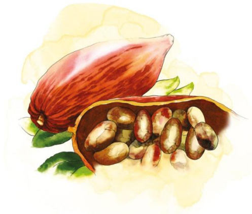
PromPerú-MINCETUR (2015). Ilustración del cacao (Acuarela). Remitida por la institución.