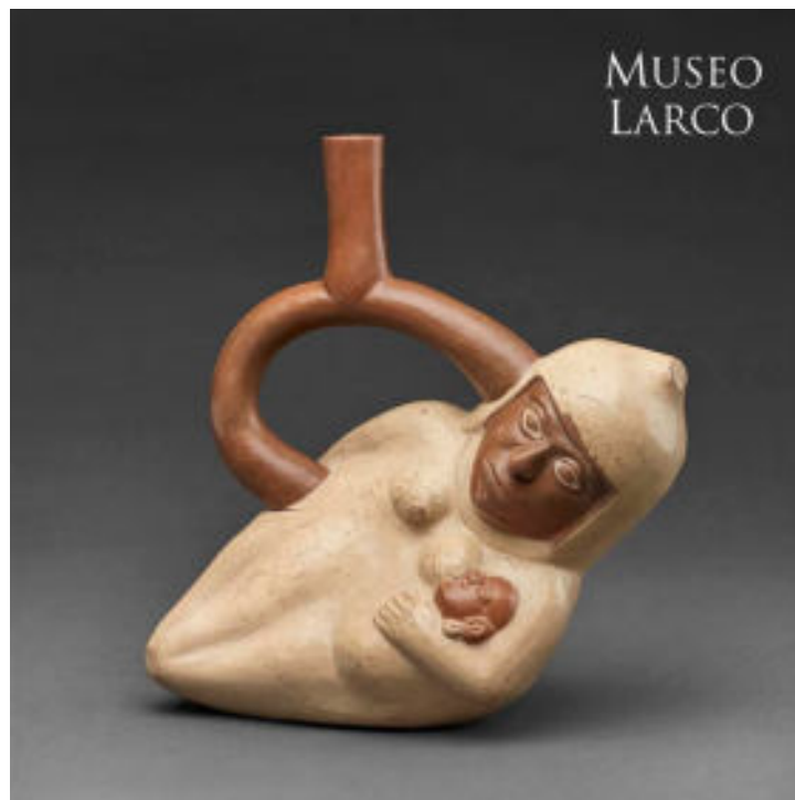
“Mamá Cacao”. Botella escultórica de cerámica mochica (1-800 d. C.). ML007314. Museo Larco. Imagen remitida por la institución.

El cacao ha sido representado por los antiguos peruanos, como en esta botella gollete asa estribo escultórica con un personaje femenino con cuerpo de cacao. En ella, una mujer está dando de lactar a un infante con orejeras, ya que, en el mundo andino, el consumo del agua de cáscara de cacao está asociado al aumento de la productividad de leche materna.